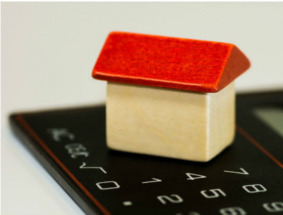
Esto se conoce como movilidad o subrogación hipotecaria.