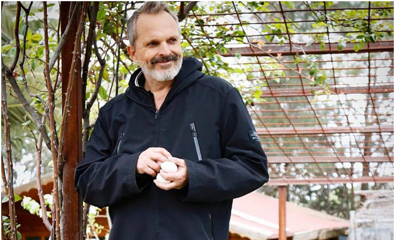
El cantante Miguel Bosé, en su casa de Madrid en mayo de 2018.