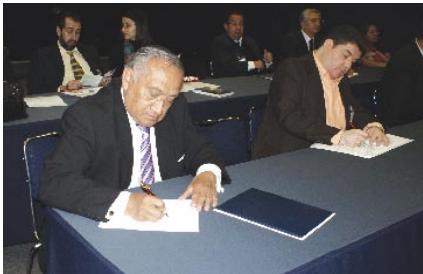
El evento contó con una gran participación por parte de los asistentes.