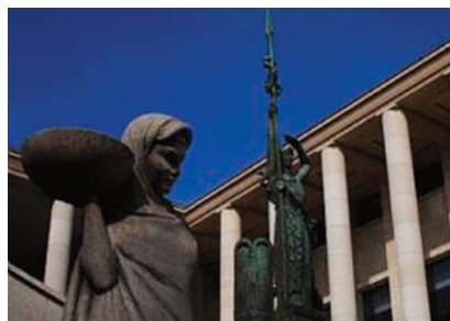
Museo de Arte Moderno de París.

Desde sus inicios, se preocupó por que las obras o piezas que formaban parte del guión museográfico transformaran el espacio y recrearan un suceso histórico o momentos cumbres de una etapa. Para el Instituto Nacional de Bellas Artes (INBA), consiguió los terrenos donde se encuentra el Museo de Arte Moderno en Chapultepec, y el edificio del Ex Convento del Carmen, en San Miguel de Allende, donde funciona actualmente el Centro Cultural El Nigromante.