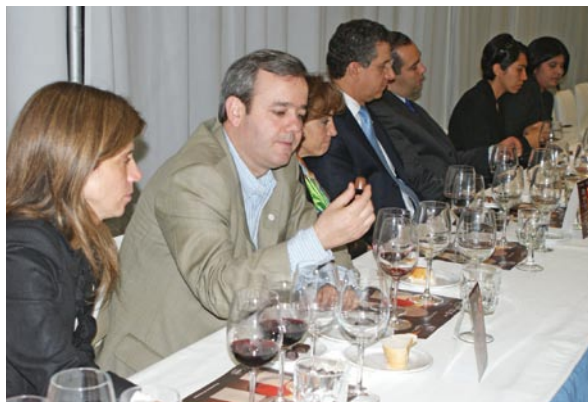
Los asistentes degustaron una gran variedad de vino.

Al comenzar la cata y guiados por el sommelier , los asistentes intercambiaron impresiones sobre los distintos sabores y aromas de los vinos y las sensaciones que les provocaron las diversas variedades de chocolates. En pocos minutos, se creó una interesante atmósfera donde el buen gusto, el sabor y la distinción fueron los protagonistas de la noche.