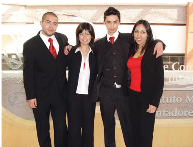
Ganadores del Tercer Lugar.

tibles ganadores. Dos de estos equipos serán los representantes a nivel Área Metropolitana en el Maratón Nacional de la Asociación Nacional de Facultades y Escuelas de Contaduría y Administración (ANFECA), por lo que les deseamos mucho éxito.