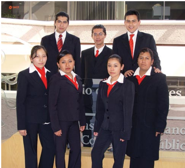
Ganadores del Primer Lugar.

Jefa Editorial Revista Veritas , Colegio de Contadores Públicos de México. veritas@colegiocpmexico.org.mx