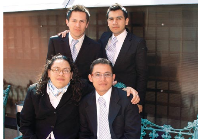
Ganadores del Segundo Lugar.

En esta ocasión, los tres primeros lugares fueron para la Facultad de Contaduría y Administración de la UNAM, a quienes felicitamos por su esfuerzo y dedicación, el cual se vio plasmado en los resultados, ya que fueron los indiscu-