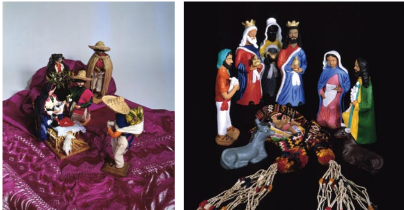
Esta exposición se presentará en tres partes, a partir del 3 de diciembre y hasta el 2 de febrero.

ra; los de metal y hoja de lata; los de concha y caracoles; así como los de vidrio, plumaria, filigrana de plata, cantera, etc.