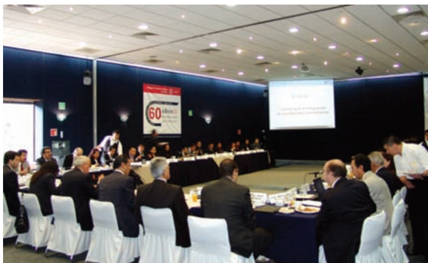
Los integrantes del CICU intercambiando puntos de vista ante el Comité Ejecutivo.