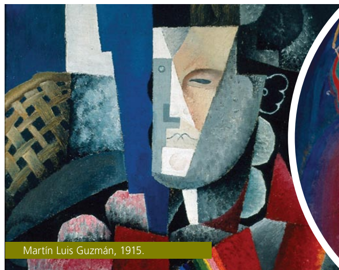
Martín Luis Guzmán, 1915.