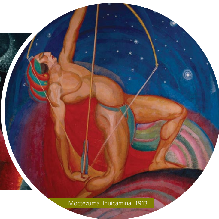
Moctezuma Ilhuicamina, 1913.

Piezas tan disímiles como la pila donde bautizaron a Miguel Hidalgo, el revólver Remington de Francisco Villa y una pintura cubista de Diego Rivera se encuentran reunidas en “México. Liberalismo y modernidad. 1876-1917”, exposición que se caracteriza por la variedad de los objetos que la conforman.