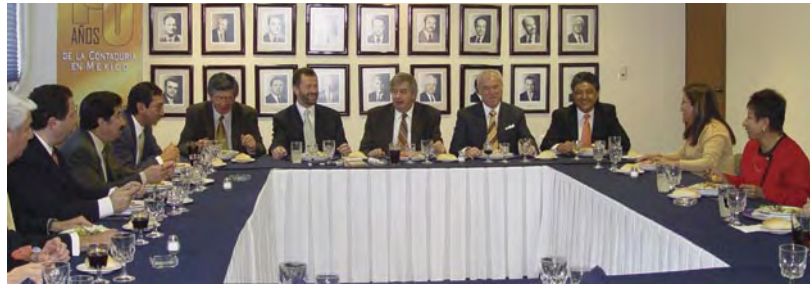
Algunos asistentes a la reunión.