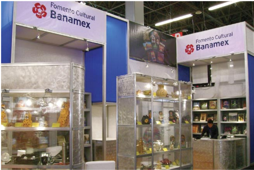
Stand en la FIL de Guadalajara.

aquellos que promueven el sentido de recuperación y la difusión del legado cultural de los mexicanos.