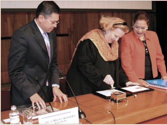
Cancelación del primer timbre postal de O'Gorman.

Crawford O'Gorman, perteneciente a una colección particular. En esta obra, se puede apreciar a Edmundo O'Gorman a los 29 años de edad hojeando un incunable, en la época en que el futuro filósofo e historiador aún practicaba la abogacía. La estampilla postal en su honor tiene un tiraje de 200 mil piezas, con una medida de 40 x 24 milímetros, y un valor de $10.50 cada una.