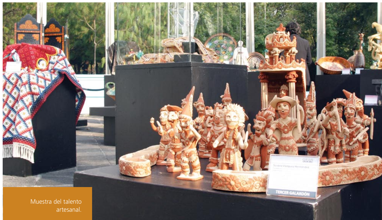
Muestra del talento artesanal.

Por cuarta ocasión, se realizó el Concurso Grandes Obras Maestras de Arte Popular y Leyendas Vivientes, en el que se reconoce en vida a los maestros artesanos que por su trayectoria ejemplar, una visión de rescate de las tradiciones locales, su generosidad por enseñar a otros artesanos, así como por su longevidad. Se les considera en un nivel diferente de participación en el ámbito del arte popular en México. Ambos concursos han sido fuente de inspiración y constante renovación entre los artistas populares para continuar creando piezas con diseños excepcionales que reflejan la diversidad y riqueza cultural de nuestro país. Los artesanos de nuestros pueblos indígenas y comunidades han conservado y transmitido por generaciones esta sabiduría ancestral para plasmar en bellos objetos de arte la profundidad y la esencia de nuestra tierra.