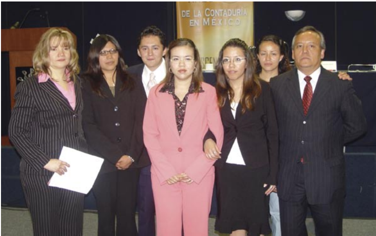
Integrantes de la ESCA Santo Tomás, equipo ganador del Maratón de Auditoría 2006.

de la Escuela Bancaria Comercial (EBC), la Escuela Superior de Comercio y Administración (ESCA) Santo Tomás del IPN, la Facultad de Estudios Superiores (FES) Cuautitlán de la UNAM, el Instituto Superior del Colegio Holandés, la Universidad Privada del Estado de Morelos campus Cuernavaca, la Universidad Autónoma del Estado de México campus Chalco, la Universidad del Tepeyac, la Universidad Insurgentes, la Universidad Panamericana (UP), así como la Universidad Tecnológica campus Atizapán.